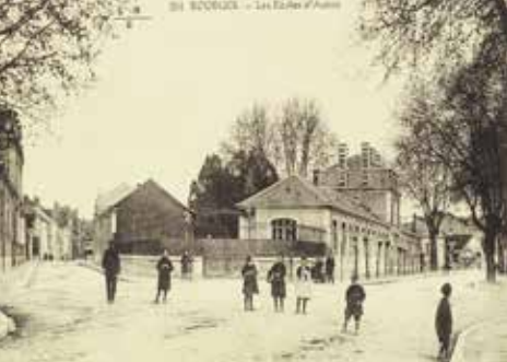
Ecoles d'Auron vers 1900