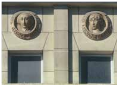
Médailles de l'internat Marguerite de Navarre © Service patrimoine

Cimetière des Capucins © Service patrimoine