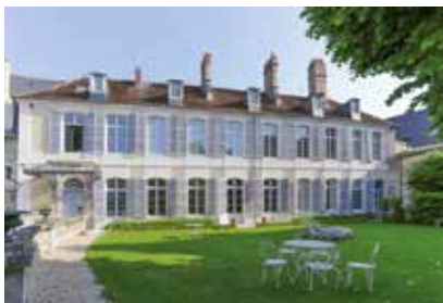
Façade sur jardin de l'hôtel de Panette

Ecoinçon du portail occidental La Genèse